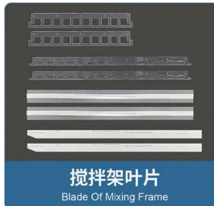
搅拌架叶片 Blade Of Mixing Frame