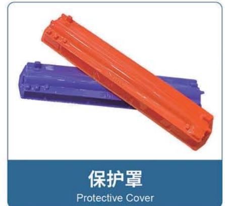
保护罩 Protective Cover