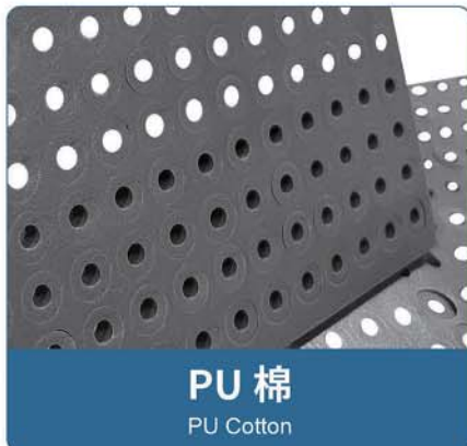
PU 棉 PU Cotton