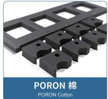
PORON 棉 PORON Cotton